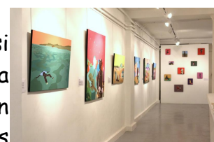
Exposition à l'espace Beaufort - Paris

Cette exposition comporte douze toiles et trois sculptures ainsi qu'une installation. Les sculptures sont plus centrées sur la surconsommation de la société actuelle, comme le livre plié, récit d'un migrant. Ce livre s'étant très mal vendu, il a fini par être brûlé, mais T.Laget-Ro a voulu en garder une trace. Quant à ses toiles, ce sont des