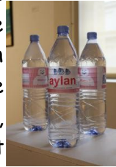
Bouteille Aylan

Toujours, exploitant l'idée de la surconsommation, que dénonce T.Laget-Ro, nous leur avons demandé s'ils se souvenaient d'Aylan (prénom qui remplace la marque sur la bouteille). Seules deux de ces personnes se souvenaient. Ce qui renforce l'idée de T.Laget-Ro sur la surconsommation de l'image médiatique : la photographie d'Aylan a servi aux médias quelque temps, avant que l'image de ce petit garçon ne tombe dans l'oubli, lorsqu'elle ne permettait plus de faire le « buzz », qu'elle ne « rapportait plus ».