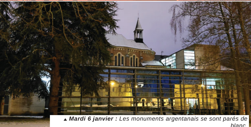
▲ Mardi 6 janvier : Les monuments argentanais se sont parés de blanc.