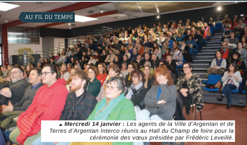
▲ Mercredi 14 janvier : Les agents de la Ville d'Argentan et de Terres d'Argentan Interco réunis au Hall du Champ de foire pour la cérémonie des vœux présidée par Frédéric Leveillé.