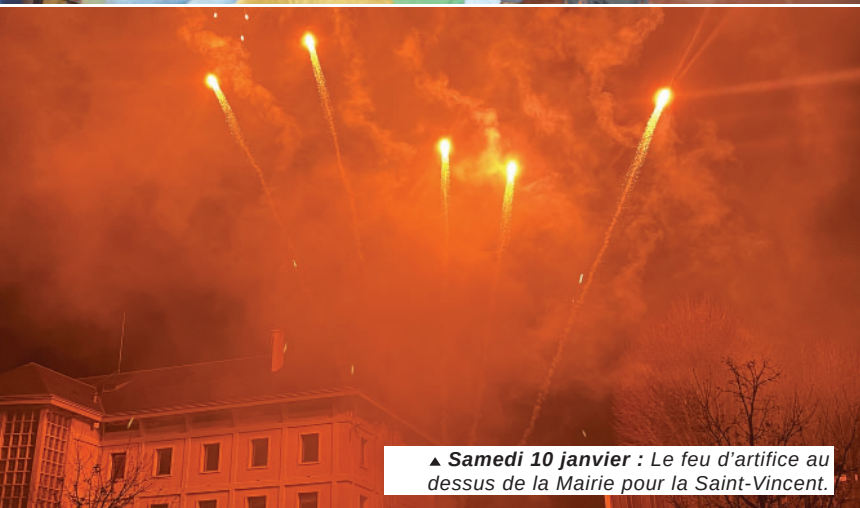
▲ Samedi 10 janvier : Le feu d'artifice au dessus de la Mairie pour la Saint-Vincent.

Le chantier de déconstruction devrait s'achever vers la fin du printemps. L'espace ainsi libéré fera ensuite l'objet d'un nouvel aménagement, notamment par la création d'espaces verts, dont les travaux pourraient démarrer avant la fin de l'année. Durant toute cette période, les lieux resteront interdits au public. Il faudra attendre au moins le début d'année 2027 pour profiter de ce nouvel espace de promenade qui reliera la rue de la République à la rue de la Vieille Prison. Les logements ne seront pas prêts avant 2028.